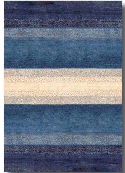
Der Scherpunkt im Sortiment von Modam liegt bei hochwertigen Gabbeh-Teppichen.